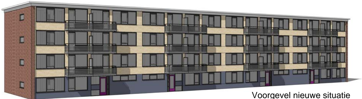
Voorgevel nieuwe situatie