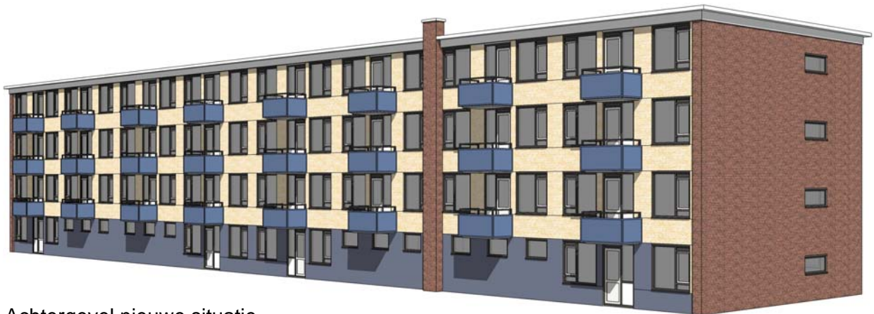
Achteregevel nieuwe situatie

Het stenen muurtje op het balkon aan de achterzijde wordt gesloopt. Op deze balkons worden nieuwe hekwerken geplaatst.